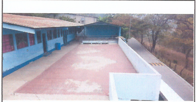
Foto 2: Necesidad de colocar un techo en el patio de la escuela que se utiliza para actividades de Educación Física.