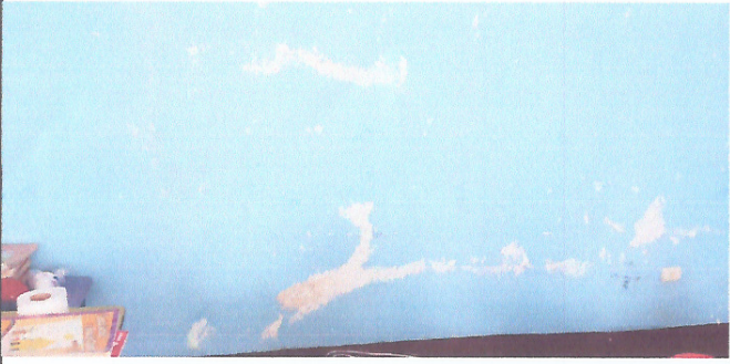
Foto 3: Filtración de agua en una de las aulas del centro estudiantil.