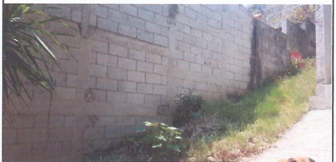
Foto 4: Mejoramiento de la cuneta para evitar la filtración de agua en el aula. (Foto 3)

Observación: Si es necesario se pueden agregar hojas adicionales y actualizar el número de hojas.