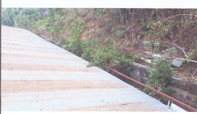
Foto 1: Mejoramiento del muro perimetral en la parte de atrás de la escuela, pues se destruyó hace varios años.